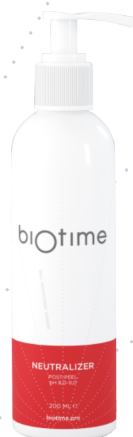
NEUTRALIZER - нейтрализатор

Объем продукта: 200 мл Расход на 1 процедуру: 2-3 мл