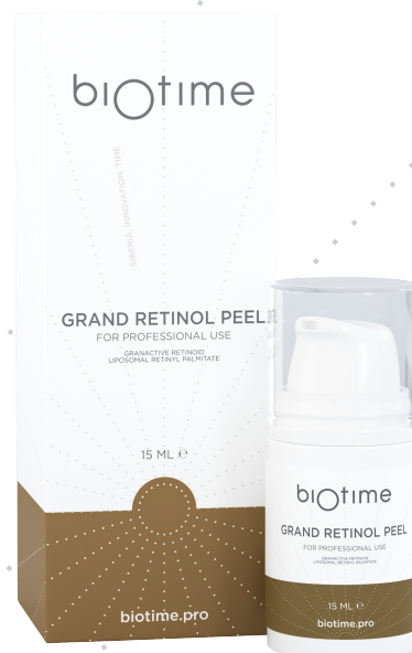
GRAND RETINOL PEEL