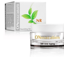
50 мл Apr.10030

Нанести на 15 минут. Смыть теплой водой. Использовать 2-3 раза в неделю.