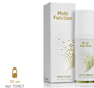
30 мл Apr.10401

Наносить крем вечером на предварительно очищенную кожу лёгкими массажными движениями. При использовании в период активного солнца, обязательно используйте солнцезащитные средства с фактором защиты не менее 30 (SPF-30).