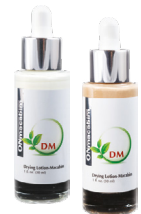
30 мл Арт. 10011 30 мл Makeup Арт. 10012

Хорошо взболтать и нанести на зоны пустул и комедонов локально или очагово. После высыхания препарата удалить остатки при помощи ватной палочки.